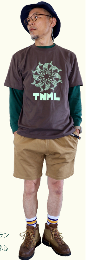
170cm 58kg M着用

TNML Fishをサークル状に配置した古着風グラフィックのTシャツです。わかる人にはわかるあのスポーツブランドの通称「風車ロゴ」のパロディ。ベースとなるTシャツはよれない、透けない、長持ちのヘビーな5.6oz。着心地、素材感ともに定評あり。ダブルステッチによって強度を上げた首リブも凝った仕様です。